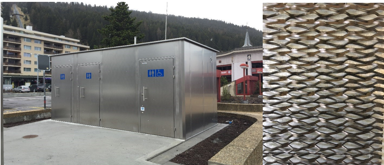
Esempio di box e rivestimento (il colore è da definire) previsto che si propone di realizzare.

Al Parco della Pace si propone, nel contempo, di sostituire i bidoni blu per i rifiuti con un arredo più decoroso, valutando anche l'inserimento di compattatori a energia solare.