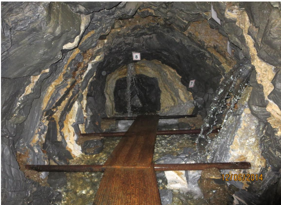
Fotografia sorgente di Remo.