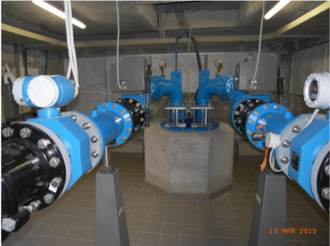
Fotografia stazione di pompaggio Morettina 2.